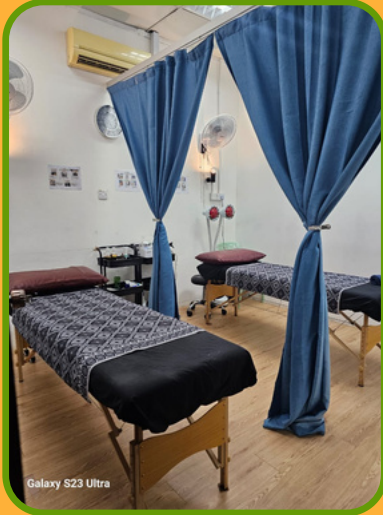
Galaxy S23 Ultra