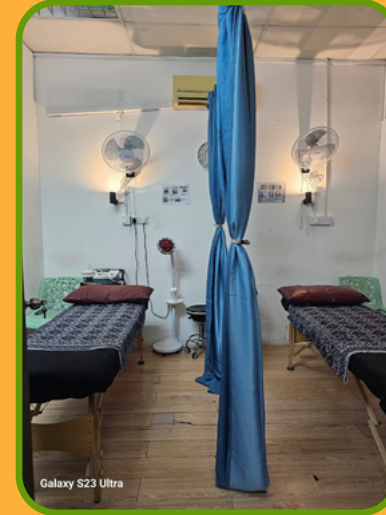
Galaxy S23 Ultra