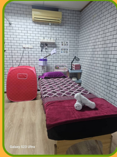
Galaxy S23 Ultra